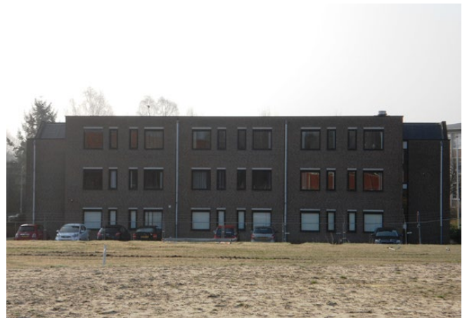
Gebouw 96 zoals het was