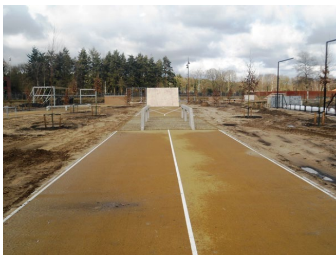
De internationale hindernisbaan

Ook zijn de pepperspray installatie (voorheen naast gebouw 50) en de brand oefencontainer (voorheen nabij gebouw 83) verplaatst naar de omgeving van de hindernisbaan.