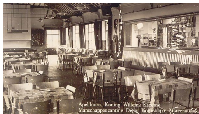
Zoals het vroeger was

Tot slot is er een prachtig terras waar een hapje en een drankje kunnen worden genuttigd. Het terras heeft negen dak platanen voor een natuurlijke overkapping en ligt tussen het KEK-gebouw en het ketelhuis.