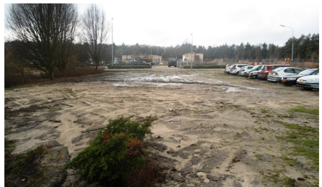
Gebouw 96 zoals het nu is