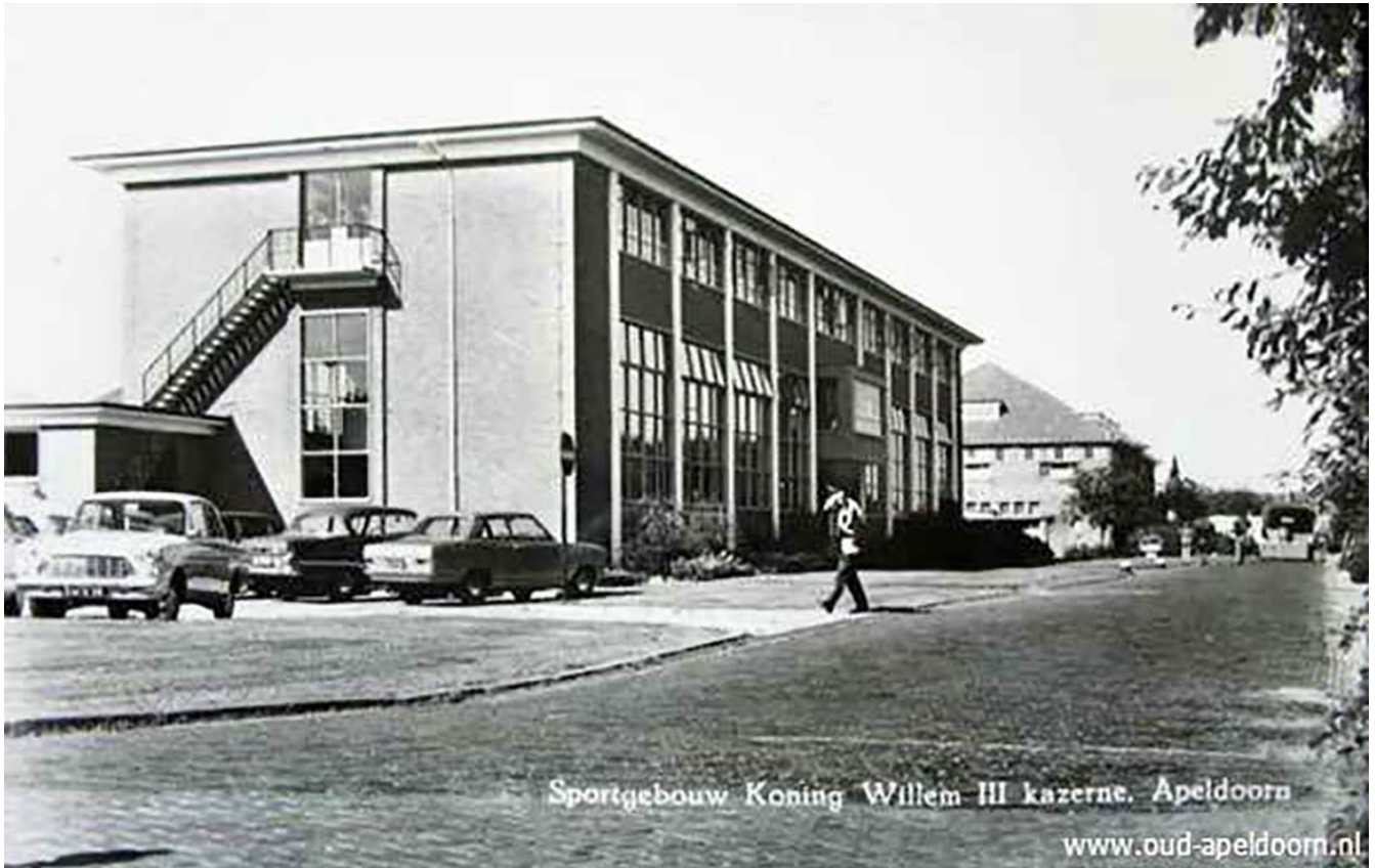
Gebouw 50 zoals het was