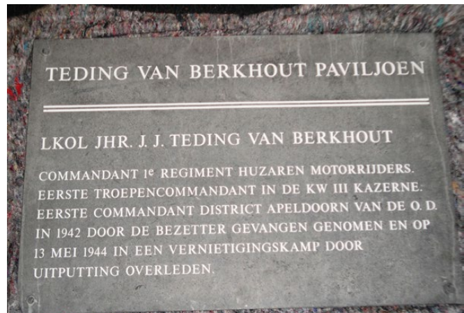
Plaquette bij de ingang