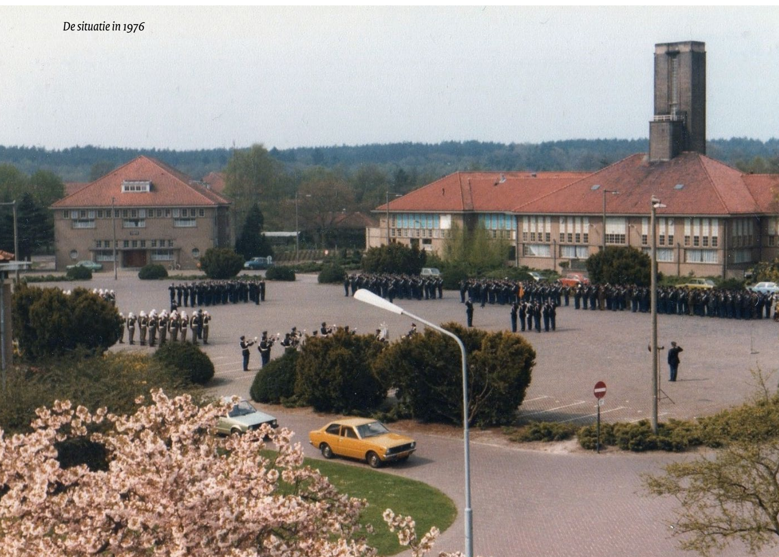
De situatie in 1976