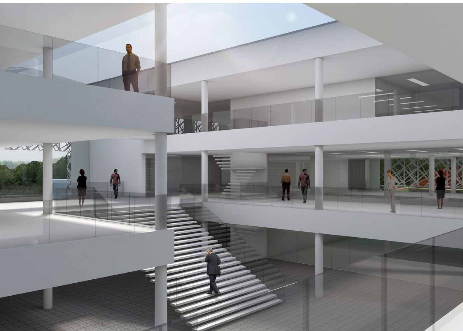
Impressiefoto: zo komt het lesgebouw er straks mogelijk uit te zien vanaf de eerste verdieping