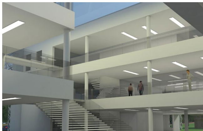
Impressiefoto: zo komt het lesgebouw er straks mogelijk uit te zien vanaf de begane grond