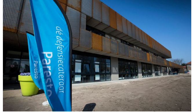
Zoals het nu is