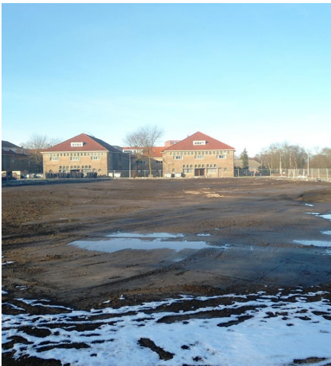
Gebouw 50 zoals het nu is

Eind januari heeft de firma Lagemaat uit Heerde de sloop afgerond van gebouw 50 (oude sportgebouw) en gebouw 96 (het oude gebouw van 103 Marechaussee Eskadron). Beide gebouwen zijn met de grond gelijk gemaakt.